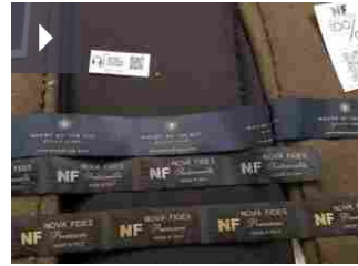
Africa illuminata con i tessuti di Nova Fides