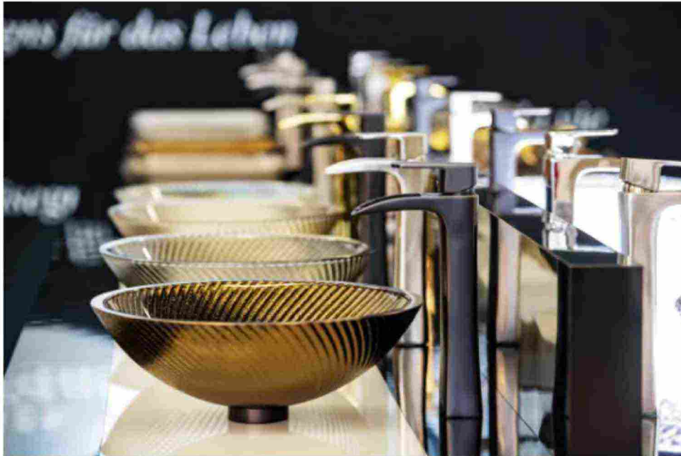
ISH Frankfurt 2020

ISH Digital 2021 mostrerà in anteprima le stanze da bagno del futuro. Presenterà nuove soluzioni d'arredo con sistemi di installazione semplici e veloci in grado di semplificare lavori di ristrutturazione e montaggio. Il bagno del futuro sarà principalmente un progetto di lifestyle e benessere, che richiederà la collaborazione e la manodopera di più artigiani. La nuova campagna di comunicazione di Pop up my Bathroom, infatti, ha come claim "Senza artigiani niente spa privata".