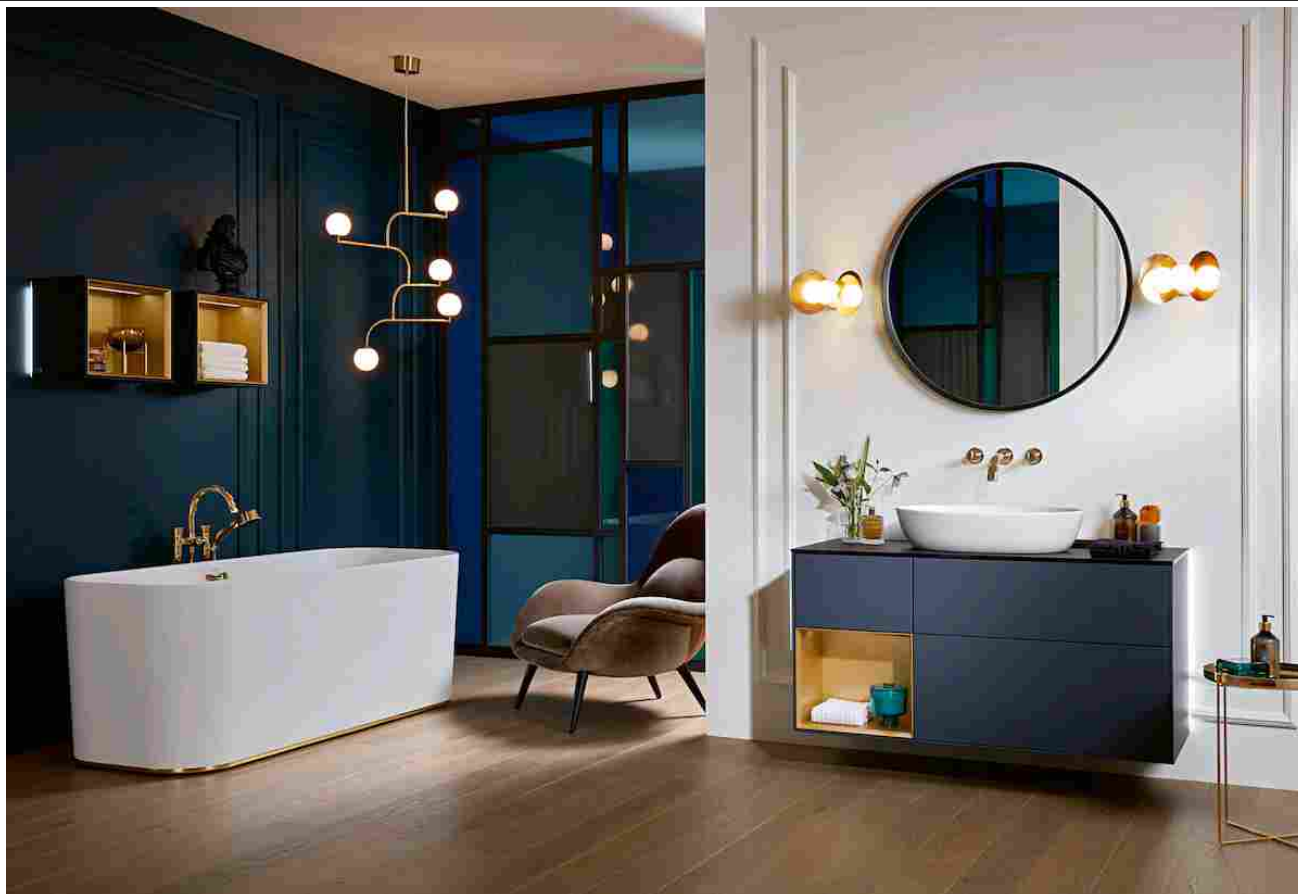
Living Bathroom: salotti personali dedicati al benessere