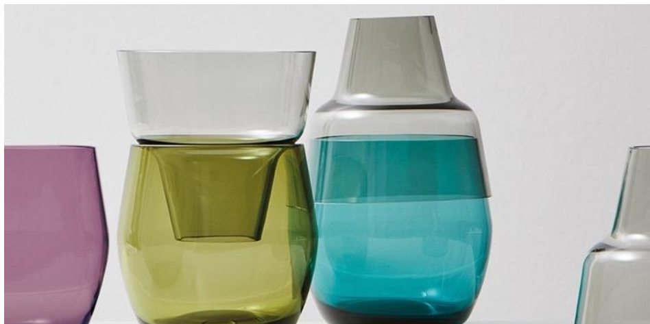
La linea di vasi "Roadie" di Annika Sparkes - area "Talents" (pad. 8.0).

Brasile, Germania, Gran Bretagna, Giappone, Italia, Portogallo, Repubblica Ceca, Stati Uniti: creare momenti piacevoli è un trend molto attuale tra i talenti del design internazionale. Nel 2020 sedici designer si presenteranno nell'area "Talents" nell'ambito di Dining, tra cui la designer tedesca Annika Sparkes. Con la sua linea di vasi "Roadie", la creativa affronta un problema noto a tante persone: per quanti vasi ci possano essere in una casa, non si ha mai quello giusto. La soluzione proposta dalla designer è un concept modulare, grazie al quale da due pezzi abbinabili si possono creare tre modelli di vasi. Il vetro di diversi colori non solo consente di mettere in scena con eleganza l'idea della modularità, ma conferisce al progetto anche una dimensione materica.