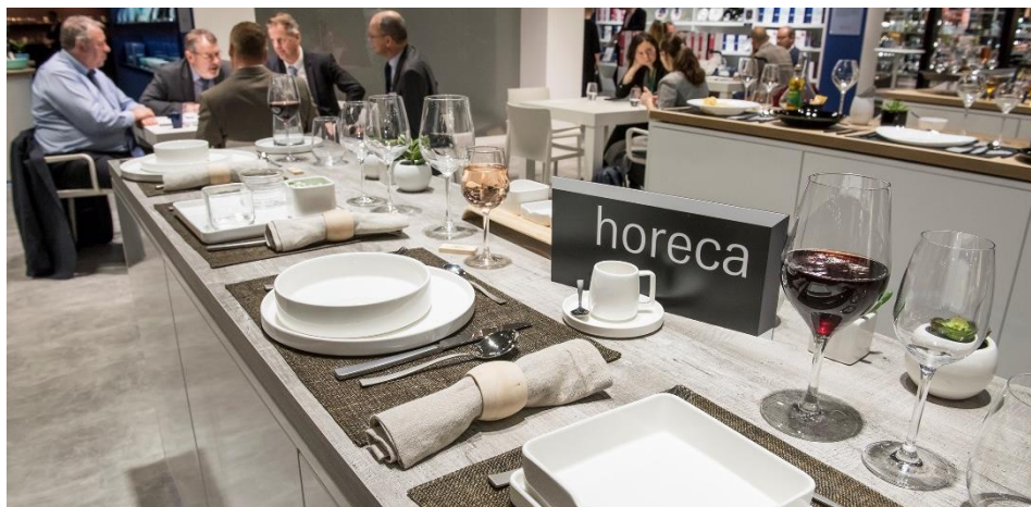
Nuovo hotspot del front of house ad Ambiente 2020: il padiglione 6.0

Con un'offerta mirata per il settore front of house il nuovo padiglione HoReCa (6.0) farà il suo debutto alla prossima edizione di Ambiente. La nuova proposta comprende i settori merceologici: Buffet & Presentazione, Chafing & Trasporto, Tabletop, Café & Bar, Cucina & Utensili da cucina, Menù, Lavagne e Display, Biancheria da tavola & Tovaglioli, così come Abbigliamento professionale & da sala, in pratica tutti gli 'ingredienti' che trasformano l'ospitalità in un'esperienza indimenticabile.