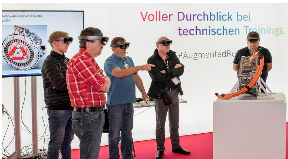
Augmented Reality Workshop ad Automechanika Francoforte.

Automechanika Francoforte si svolgerà dall'8 al 12 settembre 2020.