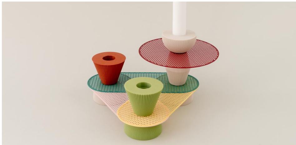
GRID Velvet – UAU project di Varsavia

Lampe e vasi 'on demand'. Lo studio di design multidisciplinare UAU project di Varsavia sfrutta i vantaggi della stampa 3D per un approccio alla produzione orientato al futuro. I prodotti della vita quotidiana possono essere realizzati ovunque la tecnologia sia disponibile, praticamente senza sprechi, rifiuti e trasporto. Per contro, il label Case Studies si concentra con i suoi articoli di maglieria sull'aspetto della vicinanza spaziale. Tutti i tessuti per la casa sono basati su studi di design e del colore effettuati nel proprio studio a Berlino e sono prodotti in Germania.